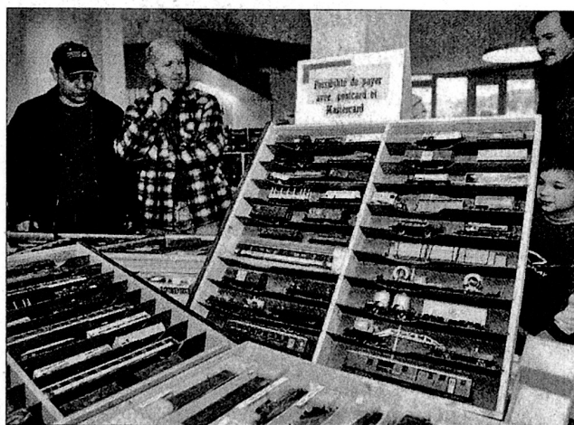
Les modèles de train allument la même étincelle dans l'œil des passionnés, quelle que soit leur génération.

Une exposition de maquettes en carton, aussi appelées «modellbogen», était également proposée au public. Cette dernière mettait notamment à l'honneur la maison d'édition «Pädagogischer Verlag des Lehrerinnen und Lehrer Vereins Zürich», laquelle distribue ses «modellbogen» dans les écoles suisses depuis plus de 90 ans. Cela dit, l'art du pliage n'est pas réservé qu'aux en-